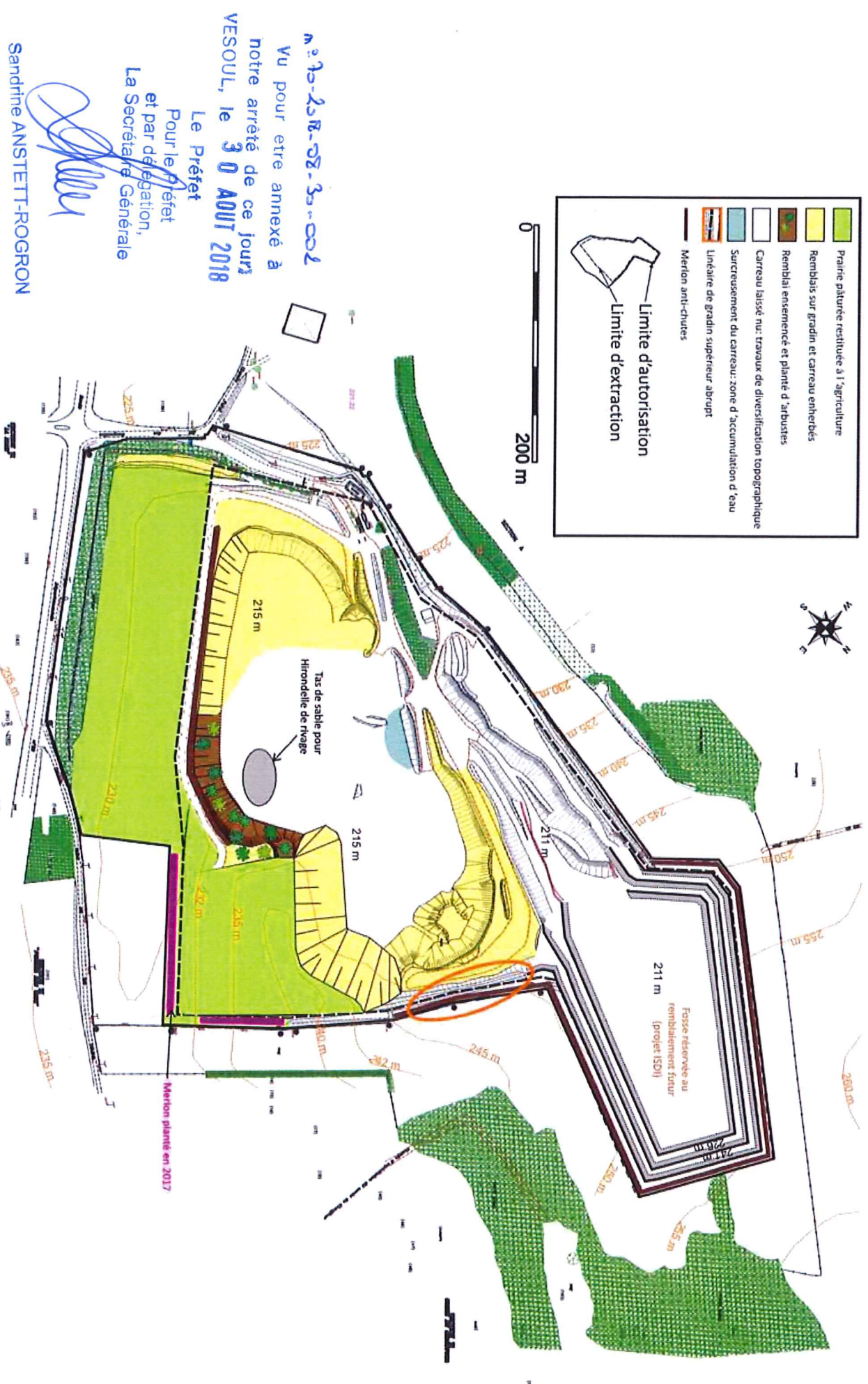
Figure 15 : Plan de principe de la remise en état